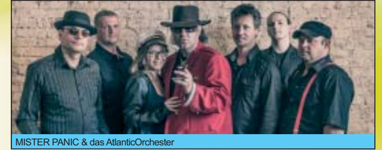
MISTER PANIC & das AtlanticOrchester